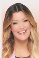
Džeimija Kerna Lima