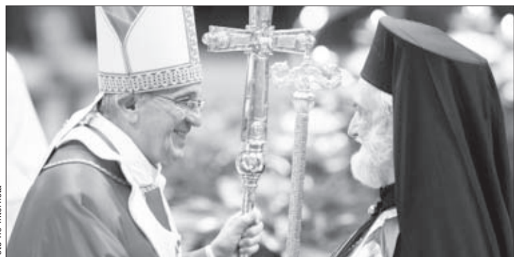
Pāvests Francisks sasveicinās ar Pareizticīgo metropolītu Jāni no Pergamonas

Evaņģēlija patiesību un to kopīgi sludināt, celebrēt dievišķos noslēpumus jaunajā dzīvē Kristū. Pāvests pasvītēja, ka vienotība, pirmkārt, ir Dieva dāvana, par ko ir jālūdzas, bet kristiešu pienākums ir sagatavot apstākļus un sirdis, lai šī īpašā žēlastība tiktu pieņemta.